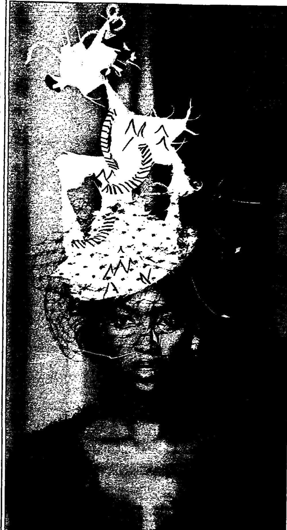
معرضة الازياء البريطانية ناعمي كامل فتمت هذا التصميم المجهز لثمنه من مبيعات بيت الازياء الفرنسي شانيل...